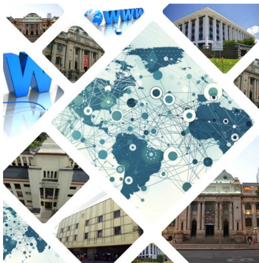
Fig. n.º 1. Las bibliotecas nacionales y su quehacer en la era digital.

Al analizar los datos reflejados en este sondeo de opinión, la edad de los estudiantes oscila entre la generación “X”, para quienes su niñez fue análoga y en su madurez tuvieron que adaptarse a la vida digital y la Millennials cuyas características es que se convirtieron en mayores de edad con la entrada del nuevo milenio y apenas recuerdan cómo era la vida sin Internet; ellos expresan, en un 90%, que las bibliotecas no desaparecerán pero se debe innovar y contar con más tecnología, ser 100% virtuales y ofrecer la información con mayor rapidez; sin embargo, es un poco contradictorio decir que la lectura en físico es mejor que en formato electrónico.