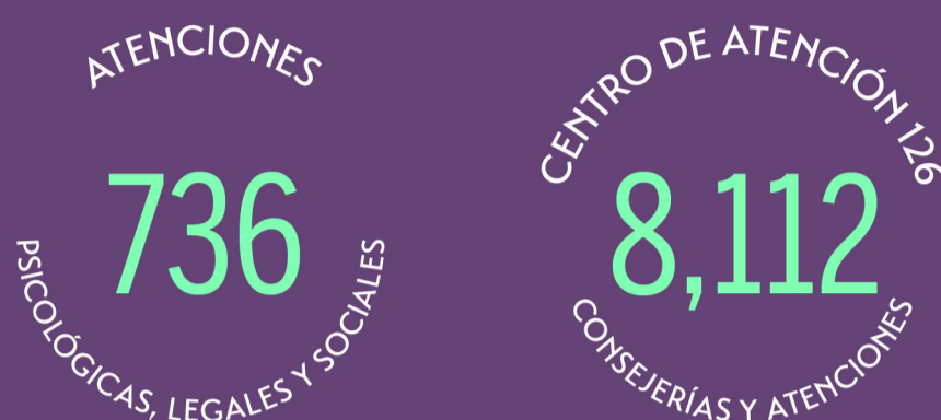
Figura 1. Número de consejerías y orientaciones brindadas por el Centro de Atención 126 a nivel nacional, El Salvador, de septiembre a octubre de 2023

El análisis de los datos del Centro de Atención 126 a nivel nacional entre septiembre y octubre de 2023 revela varios puntos clave. En estos dos meses, se ofrecieron en total 8,112 consejerías y orientaciones, aunque se observó una disminución significativa en su número, pasando de 6,634 en septiembre a 1,478 en octubre, lo que representa una caída del 77.7%. Esta notable disminución podría estar influenciada tanto por factores internos del centro como por cambios en las necesidades de la comunidad. (Ver gráfico 1).